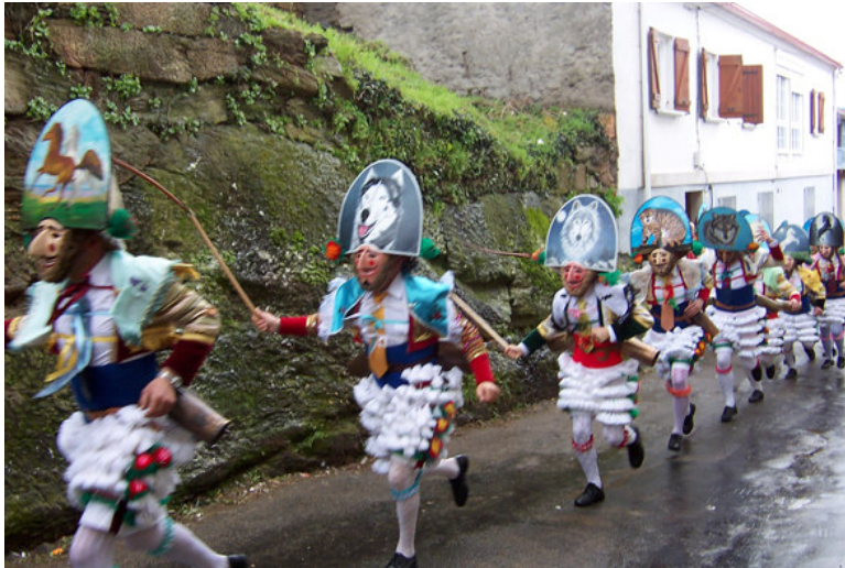
PELIQUEIROS EN LAZA (OURENSE).

Xuno (Lucina), que ninguén tallara durante moitos anos. Cando chegaron alí maridos e esposas fincaron suplicantes os xeonllos no chan, de repente axítanse as copas das árbores estremecidas e a deusa deixou oír palabras sobre colledoras polo bosque adiante: ‘Que un cabrón sagrado penetre as nais itálicas’. A multitude congregada quedou pasmada, asustada con aquela ambigua mensaxe. Un augur etrusco, do que se perdeu o nome, sacrificou un cabrón, e as mulleres, como se lles mandara, ofrecían o seu lombo para que se lles azoutase coas tiras de pel do macho sacrificado. Pasadas nove lúas os maridos foron país e as esposas nais. Grazas a ti, Lucina. O bosque (‘lucus’) deuche o nome , ou quizais tamén porque ti es dona do principio da luz.”